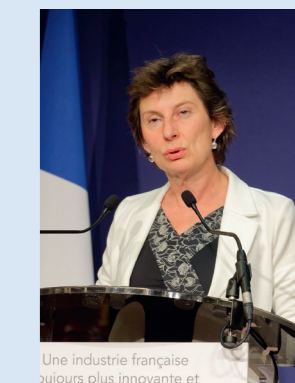
Une industrie française toujours plus innovante et

Une fois de plus on constate que les CTI répondent aux besoins d'aujourd'hui, qu'ils ont su s'adapter. Nous comptons plus que jamais sur vous, votre dynamisme, votre travail en réseau pour préparer l'économie de demain et l'industrie de demain pour que notre pays reste dans les places de tête pour l'innovation. »