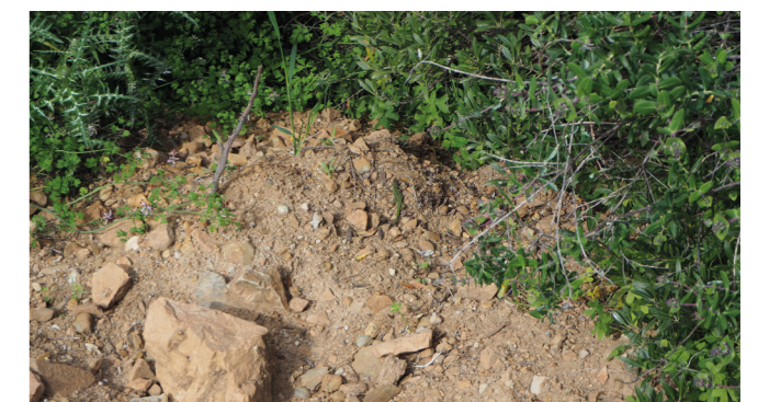
Figure 2 : Habitat du lézard des murailles

Le besoin d'installer des nichoirs pour le faucon crécerelle a été défini suite à la chute d'un arbre abritant son aire. Un suivi de la nidification a tout d'abord été effectué pendant plusieurs années. Il a été constaté que l'espèce ne s'abritait plus dans l'enceinte de la carrière, mais continuait à chasser et bénéficier des milieux ouverts. De ce fait, deux nichoirs artificiels ont été fabriqués et posés sur le tronc des arbres.