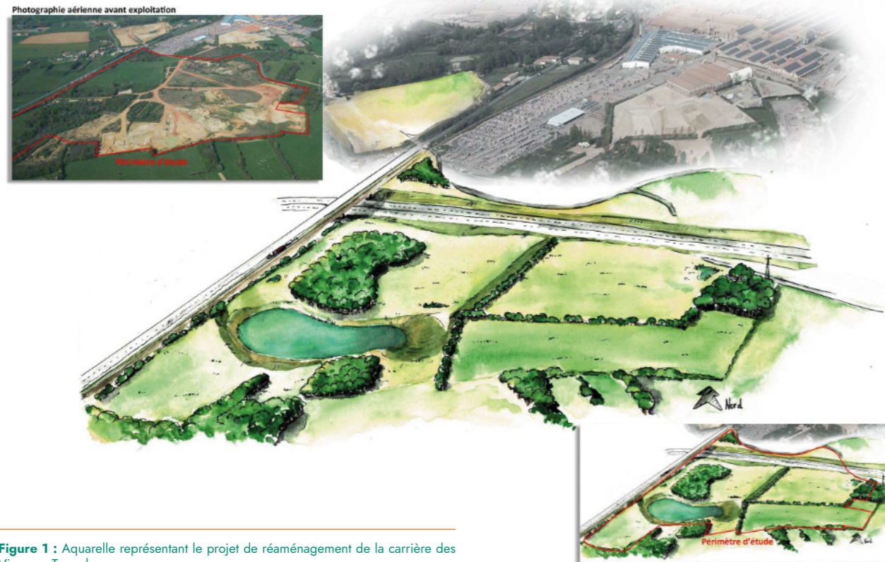
Figure 1 : Aquarelle représentant le projet de réaménagement de la carrière des Vignaux, Terreal