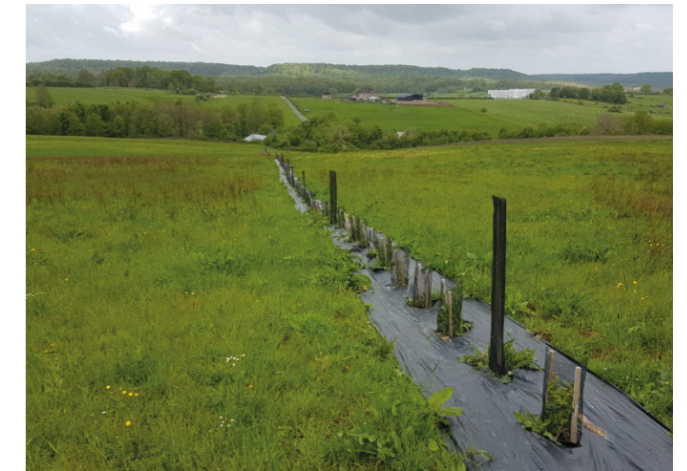
Figure 1 : Parcelles « Pré de derrière », carrière BMI de Signy l'Abbaye

Quand on souhaite exploiter une carrière, on pense initialement à réaliser celle-ci en prenant en compte des préoccupations esthétiques. Avoir des fonds de carrière bien plats, des pelouses bien tondues aux alentours et aucun arbre mort semble logique à première vue pour donner une image « propre » et « professionnelle » de l'exploitation industrielle. Cependant, ces préoccupations vont malheureusement à l'encontre des besoins de l'environnement et de la biodiversité. Lors de l'exploitation, laisser faire le plus possible la nature aux abords et dans les carrières est essentiel.