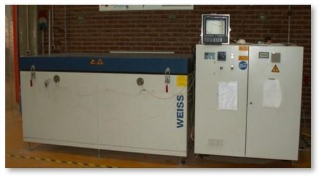
Groupe de gel