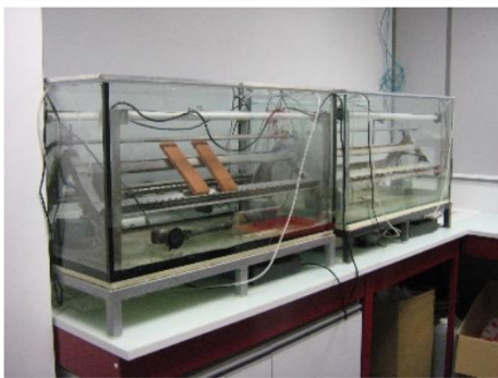
Banc de verdissement accéléré