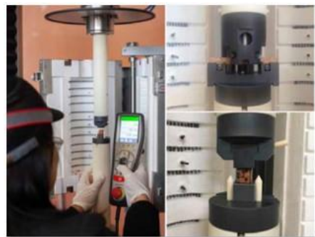
Presse haute température